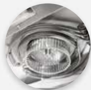
Dissipador de calor